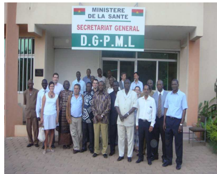
Comité International de Pilotage – Ouagadougou – Mai 10

Renforcement de l'assurance qualité (définition et mise en place de normes)